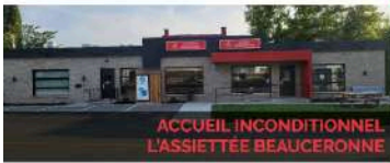
ACCUEIL INCONDITIONNEL L'ASSIETTE BEAUCERONNE